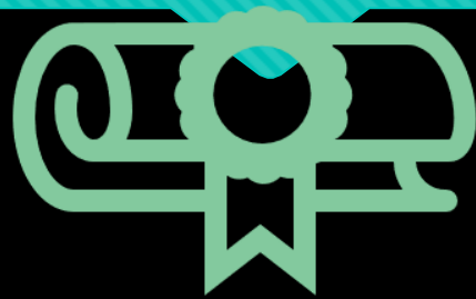
Диплома за средно образование