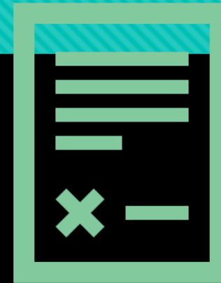
Договор с фирма за работа